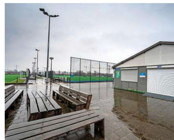
In het Diemerpark komen meer sportvelden van kunstgras.

„Dat kan de gemeente volgens Vlug doen omdat er geen harde criteria meer worden gesteld aan de pri-