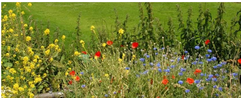
Bloemrijke dijken (Lekdijk) https://www.naturetoday.com/intl/nl/nature-reports/message/?msg=27750

De Partij voor de Dieren heeft een belangrijke aanjaagfunctie. Dat betekent dat het belang van onze punten niet altijd meteen gezien wordt, maar dat het zaadjes blijken die uiteindelijk tot ontkieming komen. Een letterlijk voorbeeld hiervan zijn de bloemrijke dijken, waar wij in 2015 een motie voor hebben ingediend. De bloemen zorgen voor een betere grasmat en daardoor een stevigere dijk én het is goed voor de biodiversiteit. In 2020 is dit o.a. toegepast voor de Lekdijk.